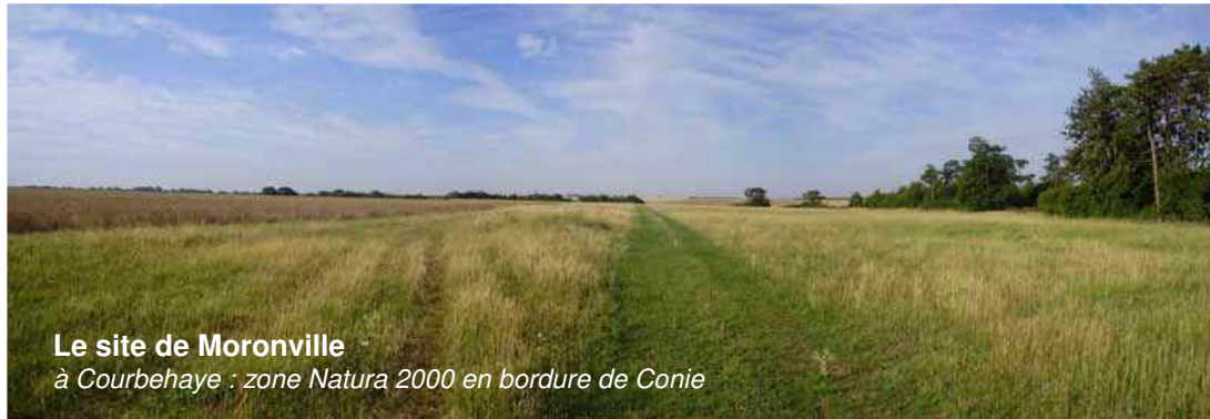
Le site de Moronville à Courbehaye : zone Natura 2000 en bordure de Conie

Les œuvres de Land Art seront installées dans quatre sites sélectionnés par les organisateurs pour leurs intérêts paysager et patrimonial :