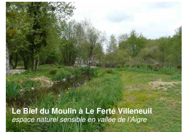
Le Bief du Moulin à Le Ferté Villeneuve espace naturel sensible en vallée de l'Aigre