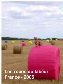
Les roues du labour – France - 2005