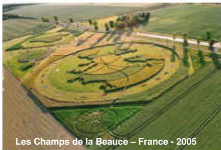
Les Champs de la Beauce – France - 2005

Cet évènement artistique au cœur de la grande plaine céréalière de Beauce, découle d'un programme de coopération européenne avec l'association Altmärkisches Aufbauwerk Apenburg e.V. (Land de Saxe Anhalt en Allemagne) et l'association Streek Raad Het Groene Woud (Province du Nord Brabant aux Pays Bas) dont les territoires présentent des similitudes avec la Beauce. Le festival a donc vocation à être organisé alternativement par les trois pays partenaires : en 2010 il a eu lieu aux Pays Bas et en 2011 il sera organisé en France, avec la participation d'artistes allemands et néerlandais.