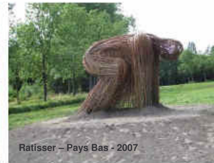
Ratisser – Pays Bas - 2007