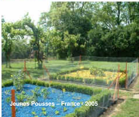
Jeunes Pousses – France - 2005