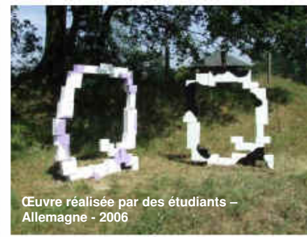
Œuvre réalisée par des étudiants – Allemagne - 2006