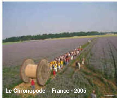
Le Chronopode – France - 2005