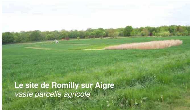
Le site de Romilly sur Aigre vaste parcelle agricole