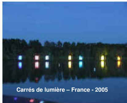
Carrés de lumière – France - 2005