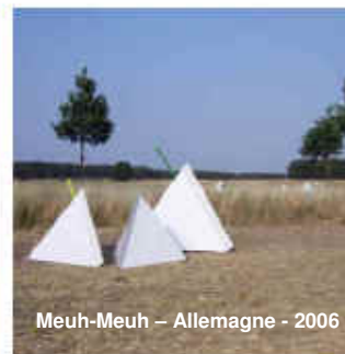
Meuh-Meuh – Allemagne - 2006