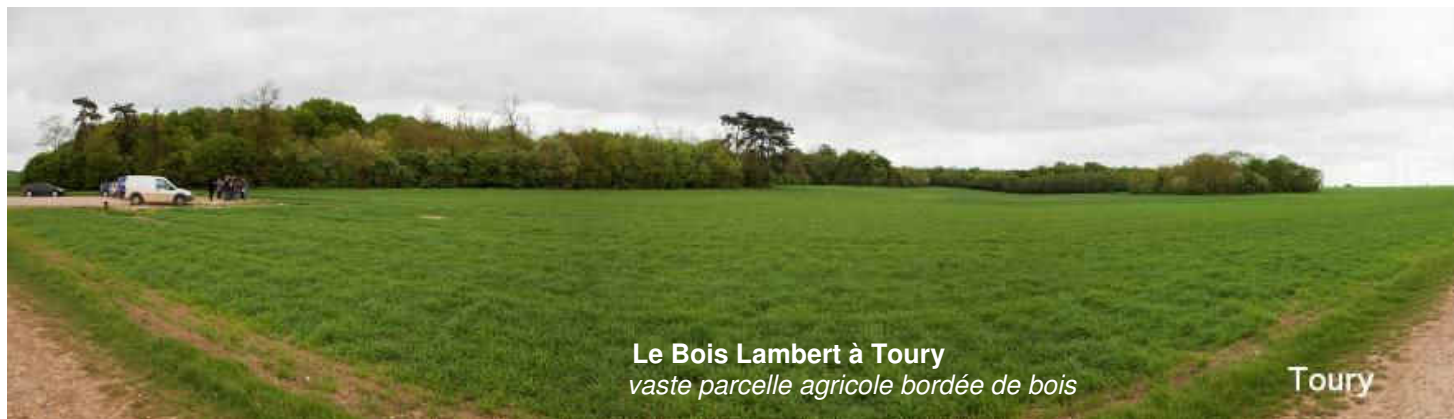
Le Bois Lambert à Toury vaste parcelle agricole bordée de bois