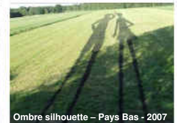
Ombre silhouette – Pays Bas - 2007