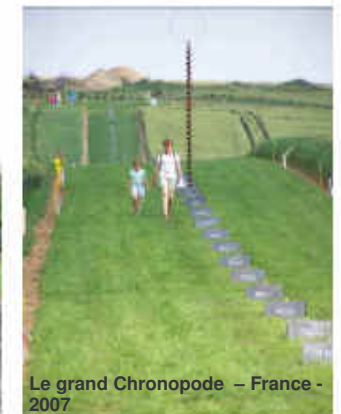
Le grand Chronopode – France - 2007