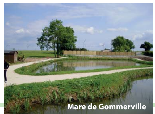
Mare de Gommerville