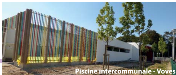
Piscine intercommunale - Voves

Réalisation d'un Plan Local de Santé : le Pays a sollicité l'ARS pour réaliser un diagnostic territorial de santé dès 2016.